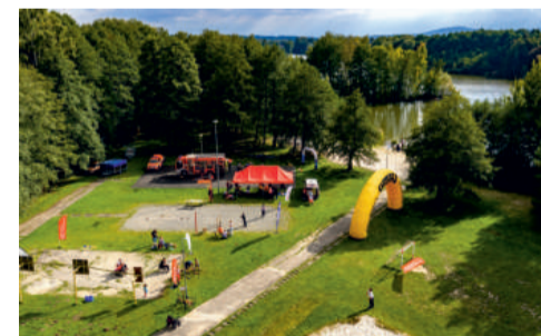
Subterra Open Weekend se koná v krásném prostředí areálu Poslův mlýn v Doksech.