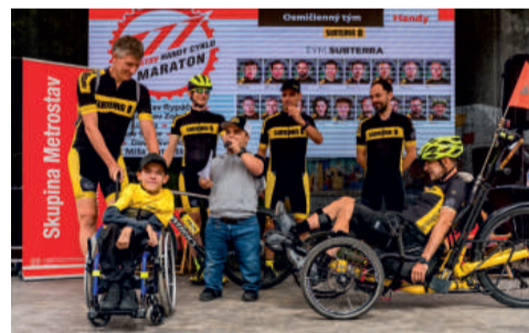
V několika posledních letech mívá Subterra v Metrostav handy cyklo maratonu dva týmy.

Kalendář Cesty za snem nabízí i mnoho dalších aktivit. Patří mezi ně kupříkladu zimní sportovní den, účast na Prague Bike Festu, projekt Lvice,