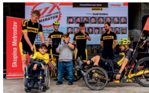
V několika posledních letech mívá Subterra v Metrostav handy cyklo maratonu dva týmy.

Kalendář Cesty za snem nabízí i mnoho dalších aktivit. Patří mezi ně kupříkladu zimní sportovní den, účast na Prague Bike Festu, projekt Lvice,