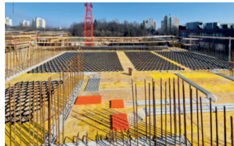
Rozvody chladicích stropů jsou před betonáží přesně koordinovány s výztuží.

K zakázce náleží také další části technického zařízení. Na střeše budou umístěna tepelná čerpadla určená pro chlazení, zdrojem energie pro vytápění bude plynová kotelna.