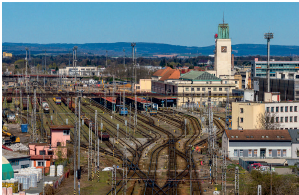
Hlavní nádraží v Hradci Králové, jehož věž tvoří jednu z dominant městského centra, budou stavební práce provázet po dobu více než pěti let.

V úterý 7. dubna se uskutečnilo slavnostní zahájení přestavby nádraží v Hradci Králové a navazujících tratí. Práce na rozsáhlé modernizaci, které se účastní divize 3, započaly již loni na podzim.