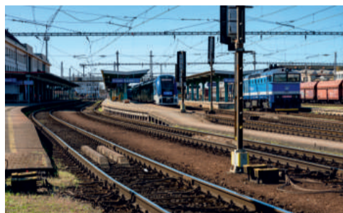
Spolu s kolejí dostanou moderní podobu také prostory pro cestující.

Modernizace královéhradecké železniční stanice má být dokončena v roce 2031.