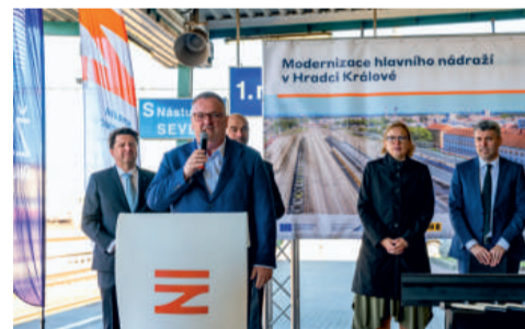
O přínosu rozsáhlého projektu promluvil mimo jiné ministr dopravy Ivan Bednárik.