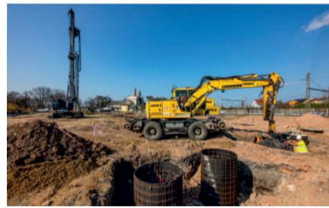
V současnosti jsou realizovány pilotové základy servisní haly.

Areál je provozem železniční mechanizace nadále využíván, stavbaře tak omezuje nedostatek volných ploch a nutnost zachovat každodenní činnosti včetně vypravování mechanizace a vlaků na stavby divize 3.