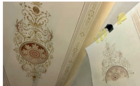
Mezi restaurátorské činnosti patří také pečlivá obnova stropních maleb.

Rekonstrukce realizovaná ve stísněných podmínkách centra metropole nyní přechází od konstrukčních zásahů, k jakým patří výměna stropních trámů či vyztužení krovů, k instalacím technických zařízení a finálním úpravám historických i nových částí.