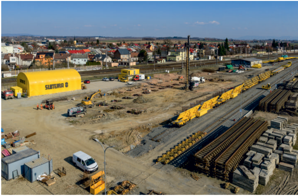
Rozsáhlý areál někdejšího cukrovaru v Brodku u Přerova, který provoz železniční mechanizace využívá od roku 2023, prochází výraznou proměnou.

Moderní zázemí pro provoz železniční mechanizace společnosti Subterra vzniká v Brodku u Přerova. V letošním roce byla zahájena výstavba servisní haly.