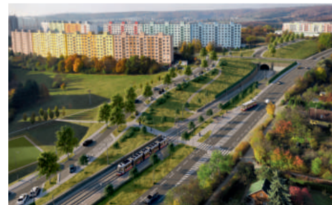
Podobu tramvajové trati včetně tunelu navrhla projektová kancelář Ossendorf.

„Navazujeme na zkušenosti z tramvajového tunelu Žabovřesky, použijeme stejná svítidla Philips.