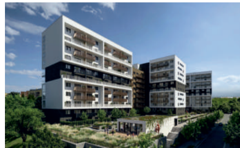
Desetipatrový objekt L1fe House sestává z několika propojených hmot.

„Stropní chlazení v betonovém jádře použité u tohoto projektu je pro nás novým řešením. O to důležitější je přesná koordinace už v přípravě a při zpracování dílenské dokumentace, protože systém má návaznost na další profese,“ vysvětluje Václav Rataj z divize 4.