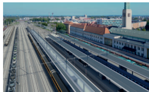
Významnou součástí modernizace bude výstavba třetího ostrovního nástupiště.