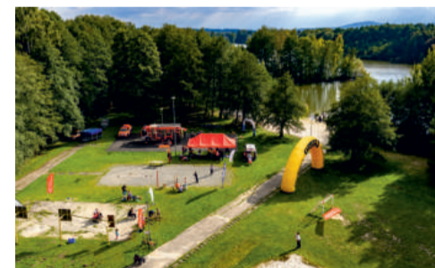
Subterra Open Weekend se koná v krásném prostředí areálu Poslův mlýn v Doksech.